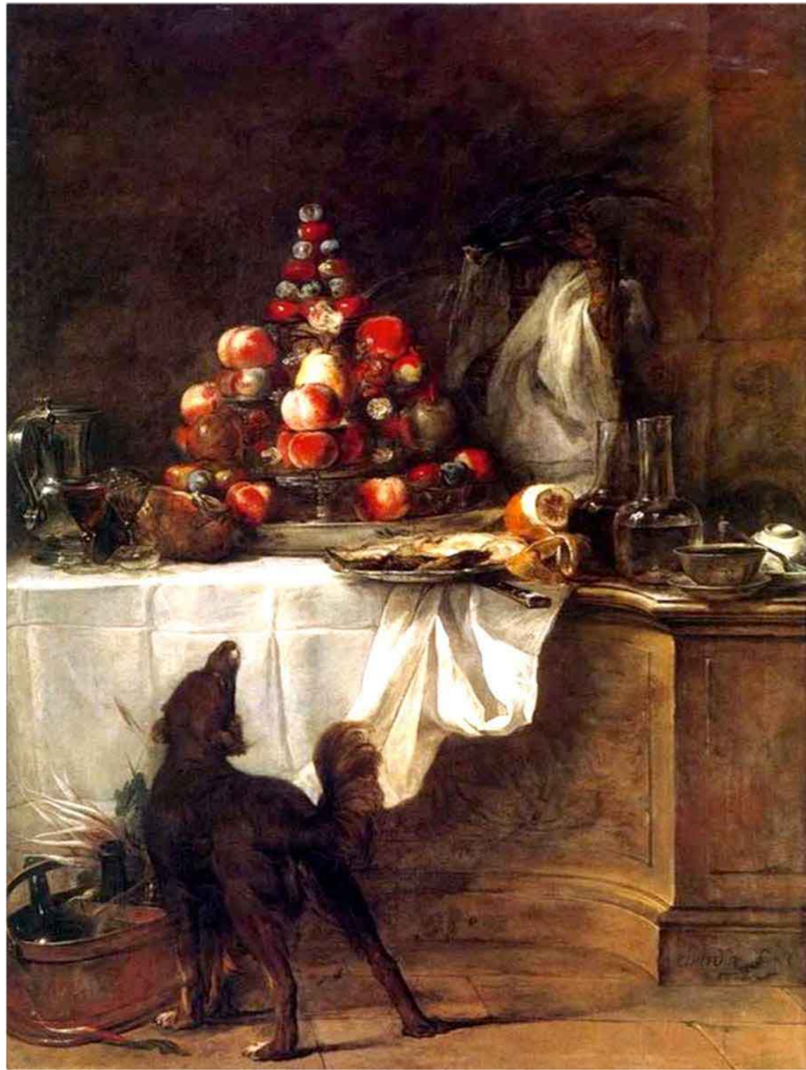
Le buffet 1728

Les peintres de mon époque aiment peindre les grands sujets religieux ou mythologiques. Je trouve ça intéressant mais je préfère des sujets plus simples.